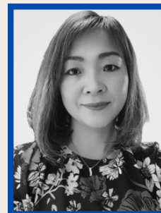
EVA (PÆDAGOG STUDERENDE)